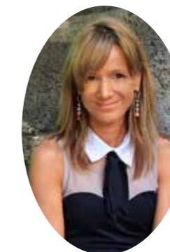
Szerző: Énekes Krisztina

Mert amikor már az sem természetes, hogy a szereteteinket megölelhetjük, mindennél fontosabbá válik, hogy számíthassunk egymásra. Akár ismeretlenül is. Mert soha nem tudhatjuk, holnap nem lesz-e pont nekünk szükségünk egy kedves szóra, vagy egy kézre, amelyik visszahúz minket, és elhitei velünk, hogy a világ tud igazán szép is lenni.